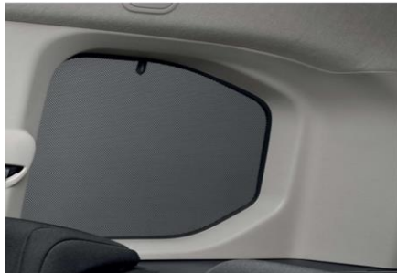
Set perdesh për dritaret prapa PZ4L0H53A0.