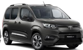
Gri e errët (EVL) metalike