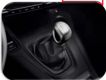
Levë marrshi PZ4L0H0112