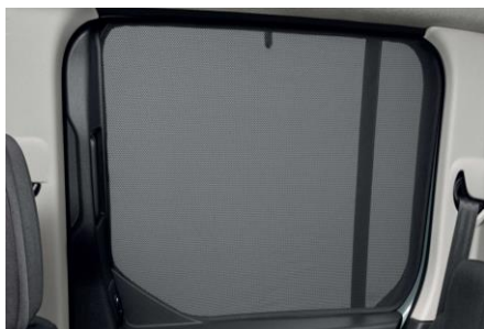
Set perdesh për dyert me rrëshqitje PZ4L0H53A1