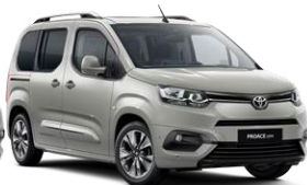
Gri e hapur (EEU) metalike