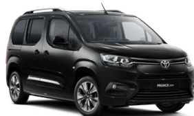
E zezë (KTV) metalike