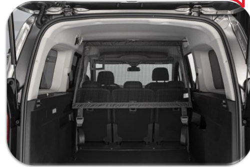
Rrjete ndarëse PZ4L0H5121

Alto Sh.p.k.- Toyota Albania Autostrada Tiranë-Durrës Km 5, Rruga Monun Nr.58, Fshati Kashar 1051 Tiranë, Shqipëri