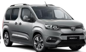
Argjend (KCA) metalike