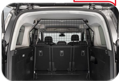
Zgarë Ndarëse për qentë PZ4L0H5122