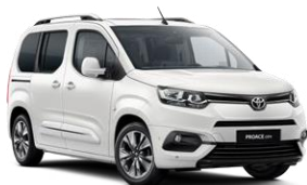
E bardhë (EWP)