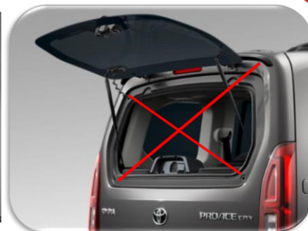
Perde për derën e bagazhit PZ4L0H53A2